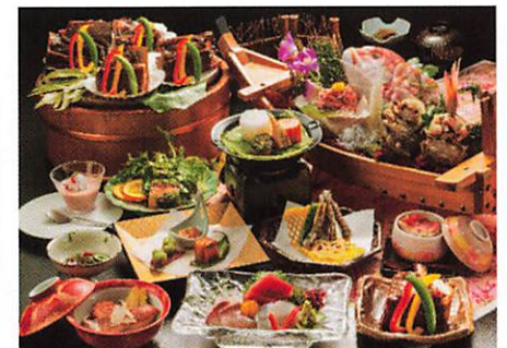
▲西伊豆予定ホテル夕食イメージ

堂ヶ島温泉(8:45)・・・入江長八美術館・・・天城浄蓮の滝・・・沼津港散策(昼 食)・・・沼津IC・・・<高速>・・・浜松IC・・・西部地域(17:45頃)