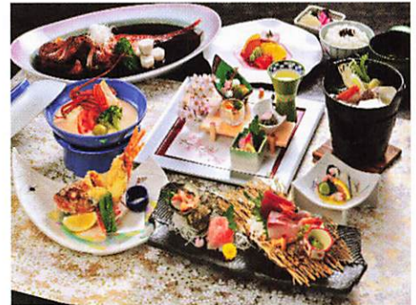
▲東伊豆予定ホテル夕食イメージ

稲取温泉(8:30)・・・城ヶ崎散策・・・伊東道の駅マリントウン(昼食)・・・沼津 港散策・・・沼津IC・・・<高速>・・・浜松IC・・・西部地域(17:00頃)